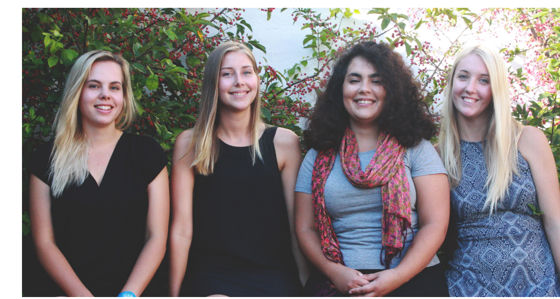
Socialhögskolans SI-mentorerna hösten 2016

Runt 18 studenter besöker varje SI-möte Helsingborg och i Lund tillhör 49 studenter den lokala SI-gruppen på Facebook. SI som står för Supplemental instruction